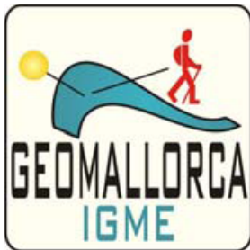
Logo de la aplicación

En el marco de esta iniciativa para dispositivos smartphone , la Unidad de Baleares del IGME ha colaborado con la puesta en marcha de una segunda aplicación llamada "Geo Mallorca" en la que se ha incorporado información referente al patrimonio geológico de la isla. Concretamente, información de 25 Lugares de Interés Geológico (LIGs) descritos en Mallorca.