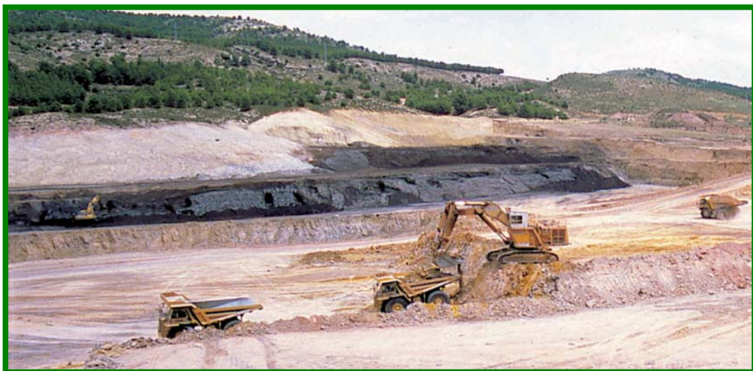
Mina de Leonardita SEPHU

La formación de la leonardita fue debida a una serie de cataclismos ocurridos en el periodo terciario, que se iniciaron en la época Eoceno (hace 60 millones de años) y finalizaron en el Mioceno (hace 25 millones de años). Estos cataclismos hicieron emerger las masas de materia orgánica, sometidas inicialmente a condiciones de carbonificación, a la superficie exponiéndolas a la humedad y oxidación, dando lugar a un proceso de humificación de millones de años.