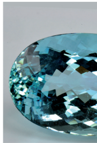
Berilo azul (aguamarina). Colección de gemas. Vitrina 283