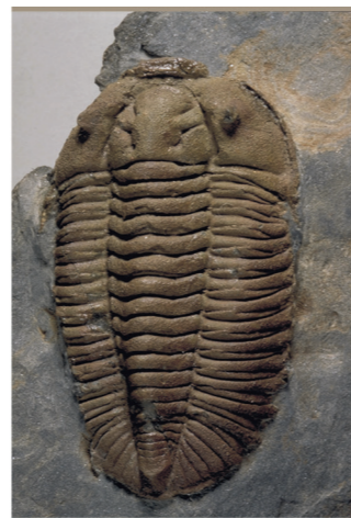
Prionocheilus mendax . Ordovícico Medio. Colección de paleontología sistemática de invertebrados. Vitrina 229