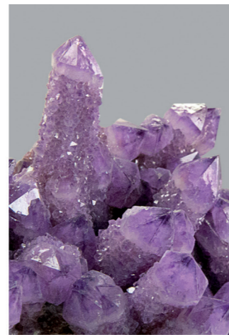
Cuarzo (amatista). Colección de sistemática mineral. Vitrina 19