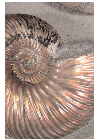
Quenstedticeras sp. Jurásico Superior. Colección de fósiles extranjeros. Vitrina 74