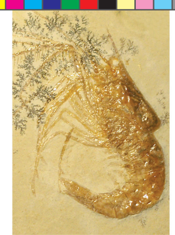
Antrimpos sp. Jurásico Superior. Colección de paleontología sistemática de invertebrados. Vitrina 228