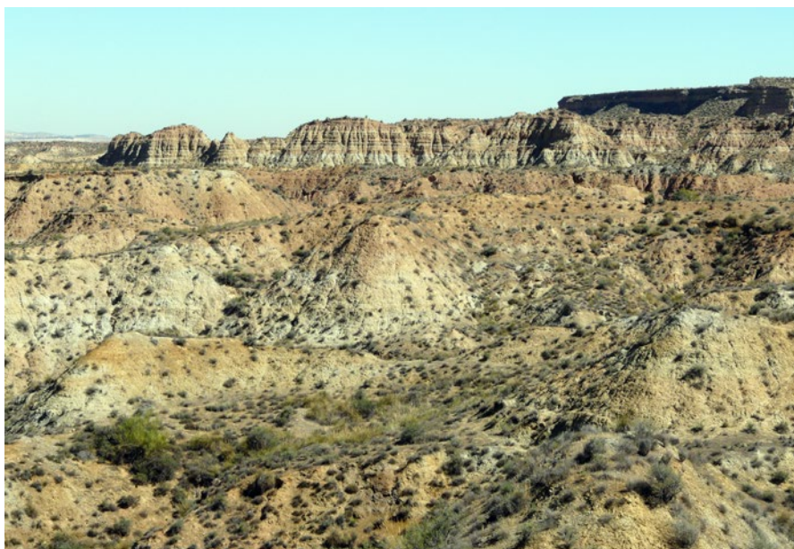
Fig. 1. Detalle del paisaje actual de la cuenca de Guadix en el término municipal de Fonelas (Granada). Las unidades expuestas en las cárcavas corresponden a parte del relleno sedimentario del Pleistoceno inferior.

El yacimiento de Fonelas P-1, enclavado a 2,5 kilómetros del municipio que le da nombre, constituye hoy día uno de los referentes paleontológicos en el Viejo Mundo sobre los grandes mamíferos que vivieron en Europa durante el Pleistoceno inferior basal (hace 2 millones de años). Su excelente registro fósil ha permitido cambiar la idea que se tenía sobre este momento del pasado y aportar valiosa información sobre