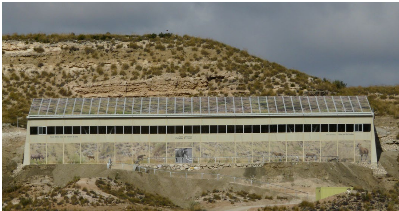
Fig. 3. Vista frontal del Centro paleontológico Fonelas P-1, que constituye la primera fase en campo de la Estación paleontológica Valle del Río Fardes del IGME en Fonelas (Granada). Esta infraestructura, de 1.020 m 2 de superficie, que protege parte importante del yacimiento paleontológico, ha sido finalizada en noviembre de 2013, se dotará de contenidos en enero-febrero de 2014 y se prevé la apertura al público en Semana Santa de 2014.

energía, hacia el antiguo río Fardes (Paleofardes). Estos huesos, aportados al lugar por los miembros de un clan de hiénidos, fueron progresivamente cubiertos por el sedimento procedente del propio pisoteo del terreno producido por los hiénidos (unidad fosilífera biogénica) y por la generación de pequeños charcos producidos por agua de lluvia y, por tanto, sellados por sedimentos limosos y arcillosos de grano muy fino. El yacimiento conserva por tanto una paleosuperficie de hace dos millones de años sobre la que habitaron los hiénidos de la especie Pachycrocuta brevirostris y en la que acumularon los huesos de los animales de los que se alimentaron. En definitiva, la asociación faunística de Fonelas P-1 puede ser considerada como testimonio de un “Hotspot” paleobiológico en el inicio del Cuaternario, asociado a un momento climático con abundancia de recursos hídricos superficiales.