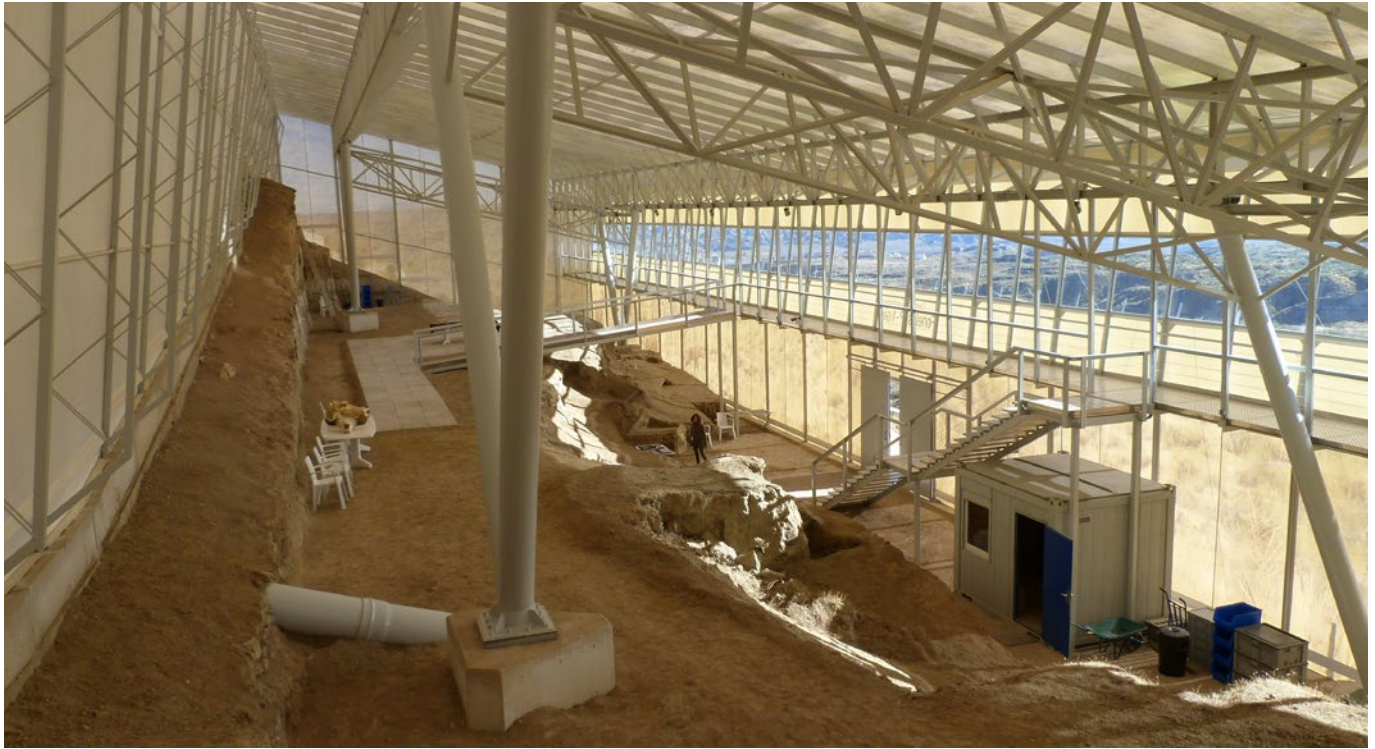
Fig. 4. Aspecto provisional (hasta la musealización) del interior del Centro paleontológico Fonelas P-1.

forma, las excelentes condiciones de observación del paisaje desde el yacimiento de Fonelas P-1 permiten ampliar formidablemente el contenido divulgativo y considerar la evolución geológica y paisajística de la comarca, constituyendo un ejemplo muy atractivo para comprender los procesos de relleno de una cuenca continental y su posterior vaciado, erosión y puesta al descubierto de antiguas capas fosilíferas. En definitiva, permite una fácil y atractiva transmisión a la sociedad de la geología de la comarca, un recurso turístico y socio-cultural indiscutible en este territorio.