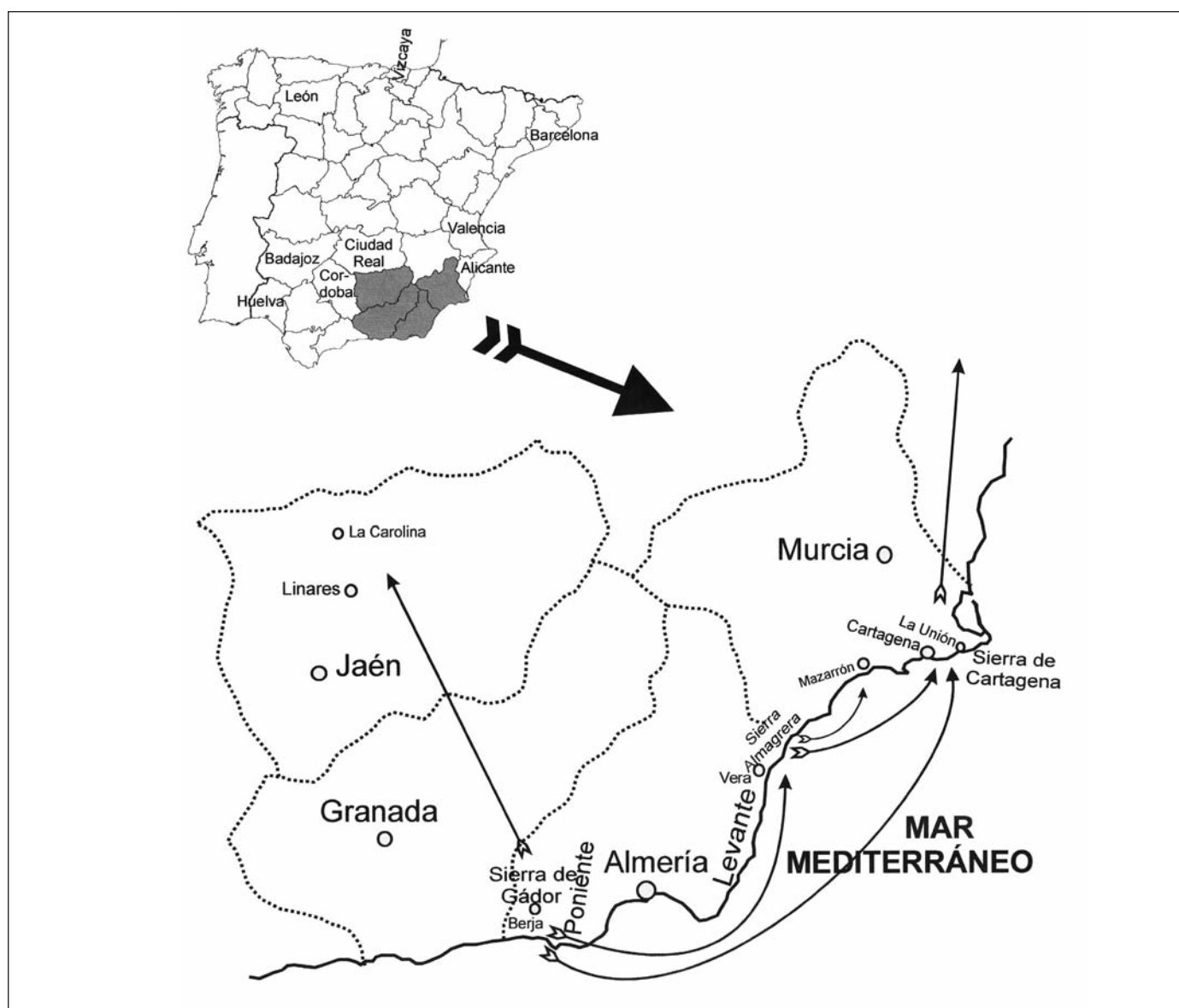
Figura 1. Flujos migratorios de los trabajadores de la minas del Sureste de España Figure 1. Migration flows of labour mining in south-east Spain

Martínez, A. P. et al. , 2008. Itinerarios migratorios y mercados de trabajo en la minería... Boletín Geológico y Minero , 119 (3): 399-418