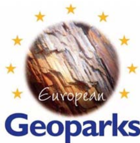
Logotipo de la Red Europea de Geoparques

La declaración de un geoparque se basa en tres principios: 1-la existencia de un patrimonio geológico destacado, 2-la puesta en marcha de iniciativas de geoconservación, educación y divulgación, y 3-creación de un proyecto de desarrollo socioeconómico y cultural a escala local basado en el patrimonio geológico. Así que tres son los pilares que sustentan la creación y funcionamiento de un geoparque: patrimonio geológico, geoconservación y desarrollo local. Para cumplir sus objetivos los geoparques deben tener unos límites claramente definidos y una extensión adecuada para asegurar el desarrollo económico de la zona, pudiendo incluir áreas terrestres, marítimas o subterráneas. Un geoparque debe ser gestionado por una estructura claramente definida, organizada en función de la legislación de cada país, que sea capaz de asegurar la protección, la puesta en valor y las políticas de desarrollo sostenible dentro de su territorio.