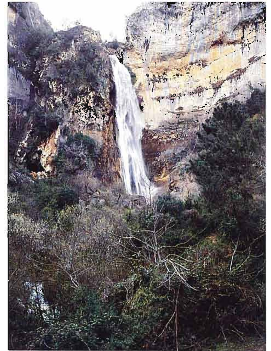
La cascada de Chocragil, en la Sierra de Cazorla, situada en la cota del embalse de Agüerocebas, aporta aguas de excelente calidad química utilizadas para el abastecimiento a los núcleos de la Loma de Ubeda. (17)

Casos de contaminación de origen industrial se han detectado en Fuensanta de Martos (Sierra Sur de Jaén), provocado por el vertido temporal de alpechines. Excepcionalmente se ha encontrado plomo en el acuífero de Sevilla-Carmona, y también metales pesados en la zona baja del acuífero del Bajo Guadalhorce.