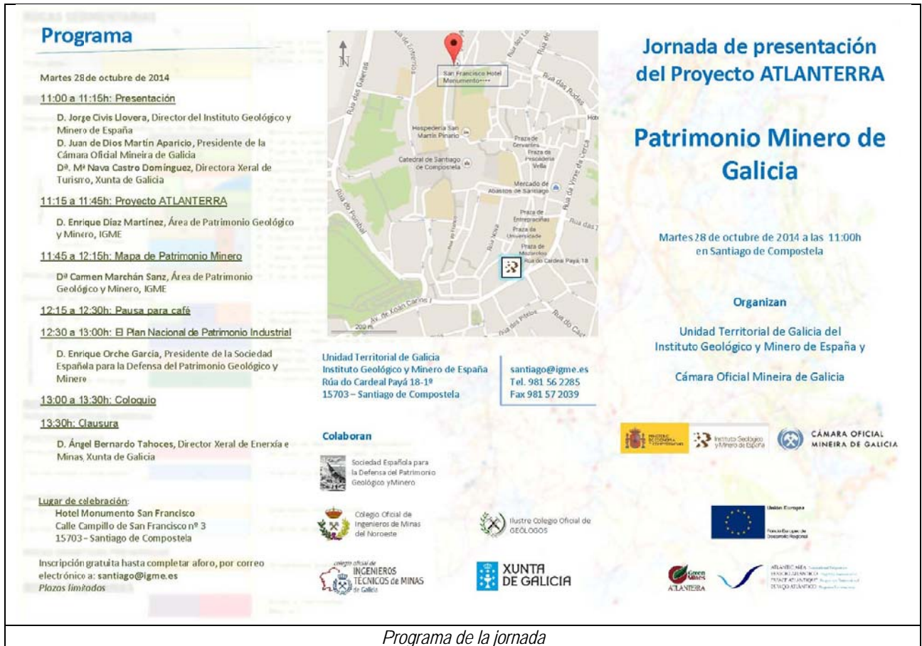
Programa de la jornada